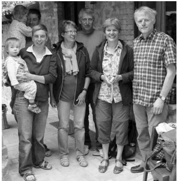
Die Lebenshaus-Kerngruppe vor dem Haus in Armenzano bei Assisi