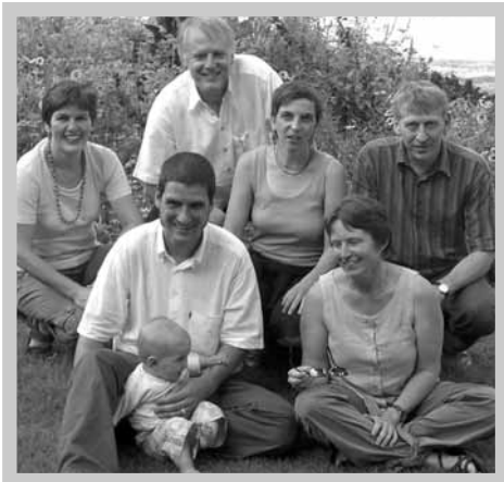
Kerngruppe August 2008

Auf eine allgemeine Anfrage hin bitten wir gegebenenfalls um eine schriftliche Bewerbung mit Selbstdarstellung und um das Ausfüllen eines Fragebogens. Daraufhin entscheiden wir über die Einladung zu einem persönlichen Gespräch und danach über die Möglichkeit eines Probewohnens. Nach einer Bedenkzeit für beide Seiten entscheiden wir uns für oder gegen die Aufnahme der Bewerberin oder des Bewerbers.