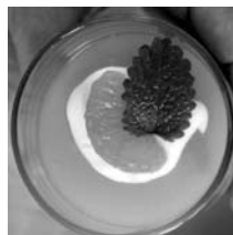
Der Nachtisch: Madarinentrifle