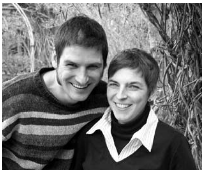
Die Vorgespräche und erste Erfahrungen des Zusammenseins bei Besu-

chen waren sehr ermutigend. Wir sind sehr zuversichtlich, dass ihr Kommen dem Lebenshaus neue Impulse geben wird. Wir sind auch sehr froh, dass durch sie die Kerngruppe wieder jünger wird, vor allem aber auch, dass sich die Aufgabe der Begleitung der Menschen im Haus und das Organisieren des gemeinsamen Lebens wieder auf sechs Schultern verteilt.